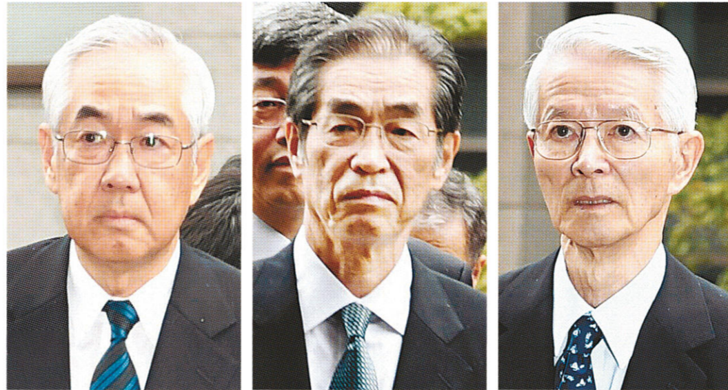
福島第1原発事故を巡る初公判で東京地裁に入る右から東京電力の勝俣恒久元会長、武黒一郎元副社長、武藤栄元副社長=30日午前、東京都千代田区