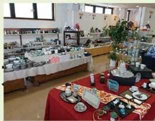
陶磁器会館 会津本郷焼直売所