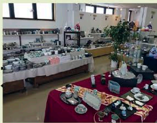
陶磁器会館 会津本郷焼直売所