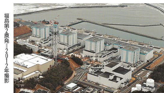
福島第2原発1〜2012年撮影

福島第2原発 楡葉町と富岡町に立地する東京電力の原発。炉心溶融事故を起こした福島第1原発の南約12キロにある。4基あり、第1原発と同じ沸騰水型軽水炉(BWR)で、いずれも出力は110万キロワット。1982〜87年にかけて営業運転を開始した。東日本大震災の発生時は4基とも運転中で、地震に伴う津波の被害を受け、1、2、4号機は一時的に冷却機能を失ったが、復旧。炉心溶融などは免れた。