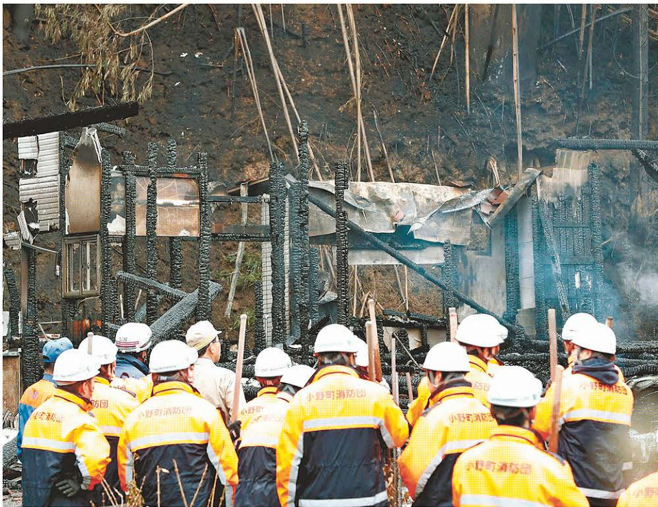
焼け跡から7人の遺体が見つかった小野町の火災現場＝22日午前9時31分