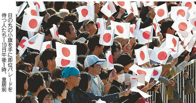
日の丸の小旗を手に即位パレードを待つ人たち。10日午後1時、皇居前