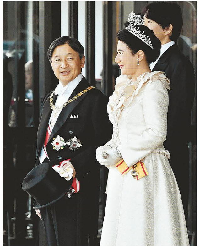
▶ 「祝賀御列の儀」に臨まれる天皇、皇后両陛下。10日午後2時57分、宮殿・南車寄