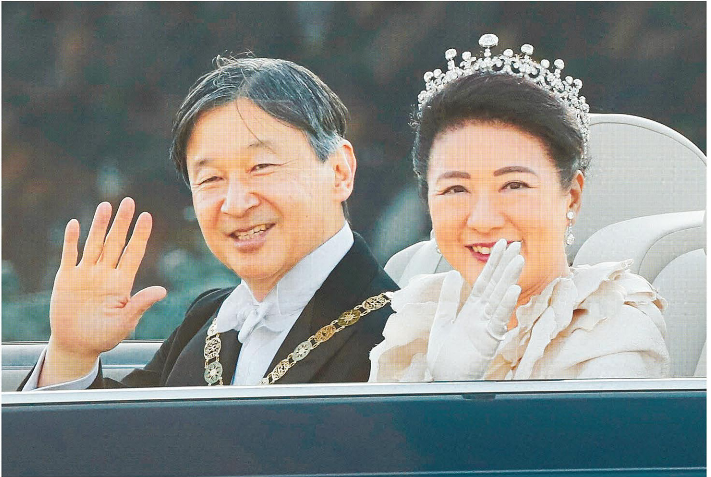
パレードで即位を祝う沿道の人たちに応えられる天皇、皇后両陛下=10日午後3時4分、皇居前広場