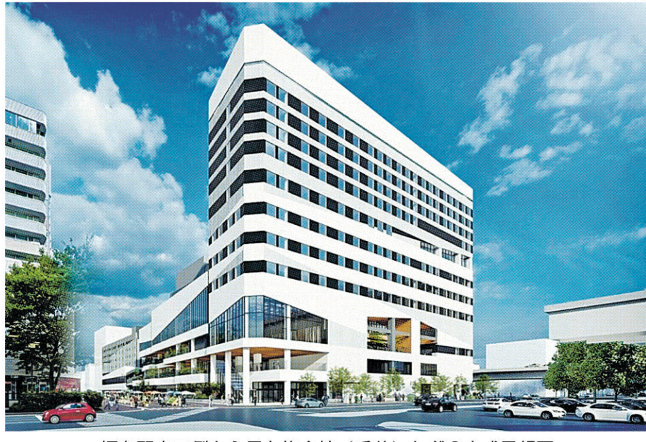
福島駅東口側から見た複合棟(手前)などの完成予想図