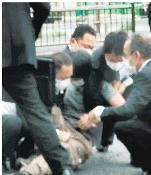
安倍元首相が銃撃された現場付近で取り押さえられる男（中央） —8日午前、奈良市

街頭演説中の安倍晋三元首相の背後に無言で男が近づくと、「ドーン」という銃声が2回響いた。8日午前11時半ごろ、奈良市の近鉄大和西大寺駅近く。集まっていた聴衆は「キャー」と大きな悲鳴を上げ、安倍