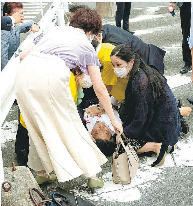
奈良市で街頭演説中に銃撃され、路上に倒れた自民党の安倍元首相(中央) = 8日午前11時32分